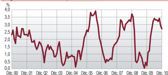
Variation des prix à la consommation (en glissement sur douze mois)

En termes de contribution à l'inflation, c'est-à-dire compte tenu des poids respectifs des trois grands postes dans l'indice des prix, les 2,7% d'inflation se décomposent en 1,1 point pour les produits manufacturés, suivis de l'alimentation et des services pour 0,8 point chacun. Dans le détail, plus du tiers de l'inflation s'explique par les «tabacs» et les «carburants» (0,5 point chacun). Le reste se partage entre les «soins des hôpitaux et assimilés» (0,3 point), les «légumes frais» (0,2 point) et l'«eau distribuée» (0,2 point).