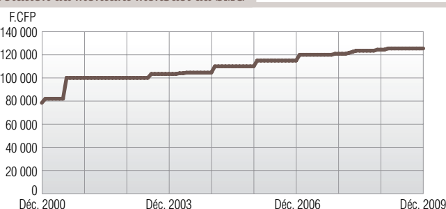
Évolution du montant mensuel du SMG

C'est toujours dans ce souci de revalorisation du pouvoir d'achat que le gouvernement a annoncé, fin 2009, une nouvelle revalorisation du SMG. La Loi du pays du 15 janvier 2010 écarte ainsi à nouveau les règles de l'ordonnance de 1985 dans le but de porter le SMG à 150 000 F.CFP d'ici mi-2012.