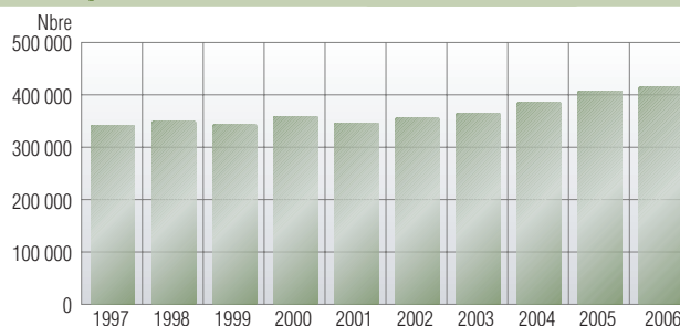
Évolution du trafic de passagers à l'aéroport de Tontouta (arrivées + départs)

Au regard des compagnies aériennes qui desservent le territoire, 2006 a accentué le phénomène de concentration en faveur d'Air Calédonie International (Aircalin) et d'Air France. En effet, le nombre de passagers d'Aircalin a augmenté de 4,0% sur un an et, en 2006, la compagnie a transporté 62,3% des passagers fréquentant l'aéroport ; parallèlement, Air France, dont les avions n'effectuent plus le tronçon Nouméa-Tokyo, mais qui continue de commercialiser la destination en achetant des places sur les avions d'Aircalin, présente une hausse de 6,9% et