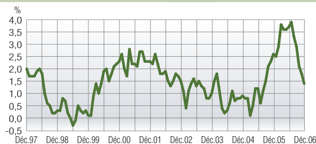
Variation mensuelle des prix à la consommation (en glissement sur douze mois)

Enfin, la hausse des "tabacs", règlementée par l'arrêté n°2006-