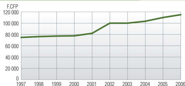
Évolution du montant mensuel du SMG sur dix ans (au 1 er janvier de chaque année)

pondant à un taux horaire de 680,5 F.CFP. Globalement, le SMG a connu une hausse de 55,6% en dix ans, dont les plus fortes augmentations se remarquent ces 5 dernières années, illustrant ainsi l'intervention des pouvoirs publics afin d'améliorer le pouvoir d'achat des bas salaires.